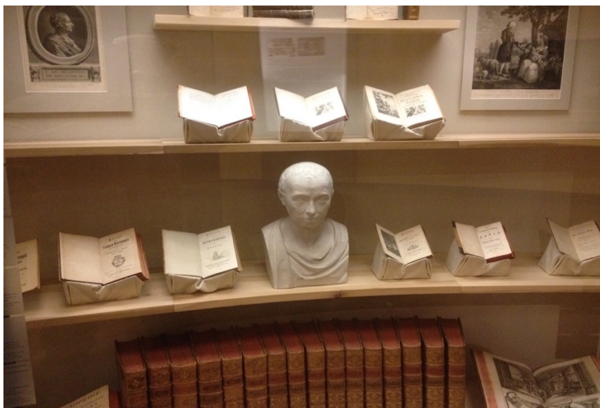
Busto de Kant sobre la Enciclopedia entre grabados y obras de Diderot y Rousseau (Exposición permanente del Museo Histórico de Berlín)

https://elpais.com/cultura/2019/09/18/actualidad/1568834287_814388.html