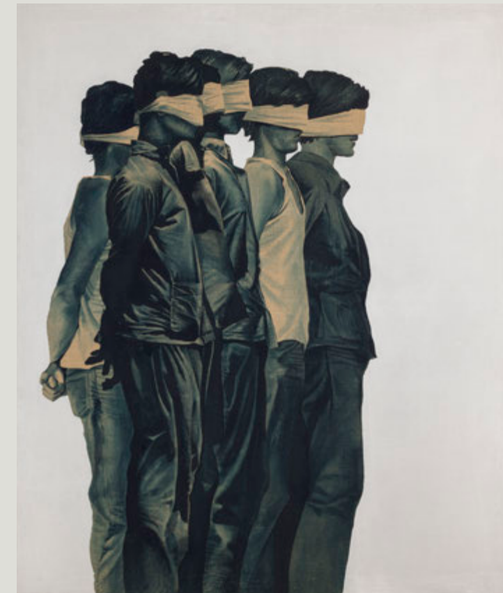
Juan Genovés Seis jóvenes, 1975 Acrílico sobre lienzo Universitat de València. Colección Martínez Guerricabeitia, Valencia Número de inventario 47 Universitat de València. Colección Martínez Guerricabeitia.