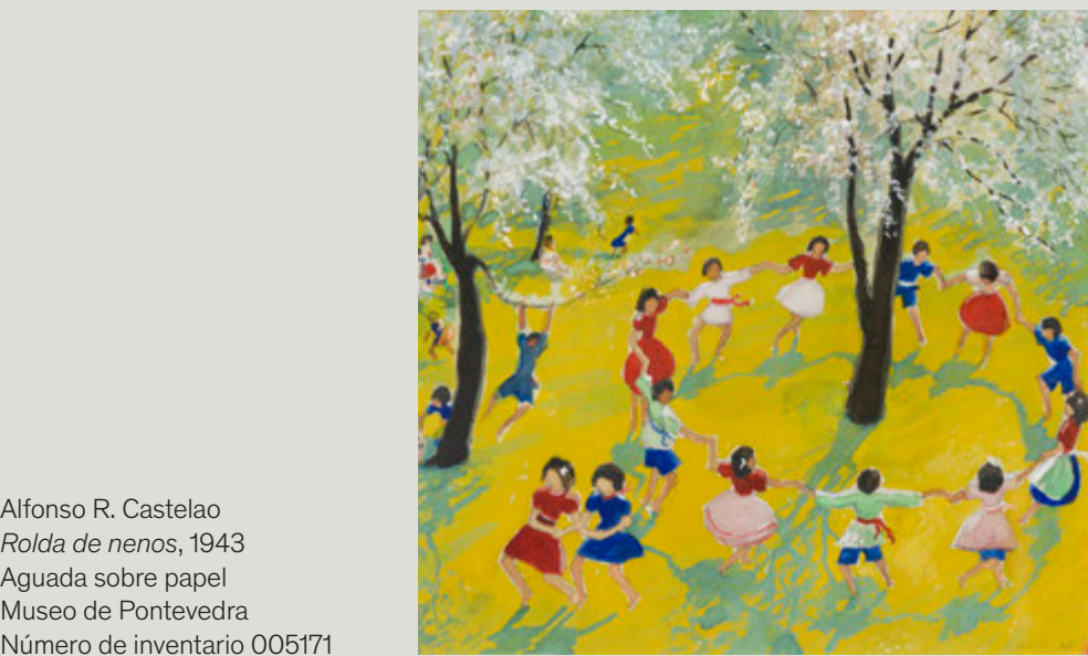
Alfonso R. Castelao Rolda de nenos , 1943 Aguada sobre papel Museo de Pontevedra Número de inventario 005171

principales potencias mundiales al bando franquista desequilibró radicalmente la contienda desde su inicio, haciendo discutible el carácter «civil» que se le suele atribuir y subrayando su dimensión geopolítica. No en vano, en la época, se hablaba de la «guerra de España». En cualquier caso, la evocación democrática de aquella guerra nos habla hoy de experiencias de resistencia, de cuidado y apoyo mutuo, siempre desde el marco general de una memoria democrática.