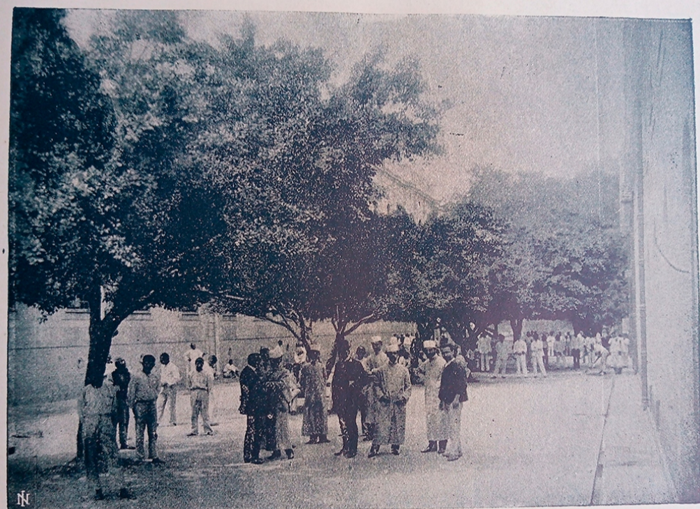
PATEO DA SECÇÃO < PINEL >